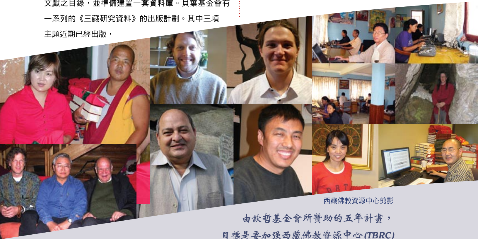
西藏佛教資源中心剪影

過去一年，基金會贊助許多法教翻譯計畫。有些由仁波切指示，有些則由其他翻譯團隊發起。在語言的學習和訓練上，對於有志從事法教翻譯的學生，則提供獎學金或特別補助。