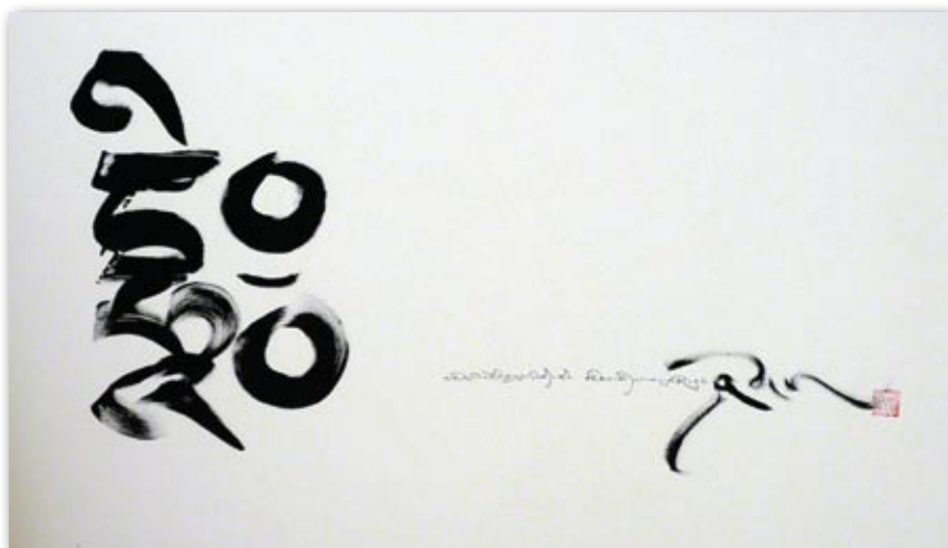
宗薩欽哲仁波切為護持蓮心基金會親書「DHI」字

道爾敦教授的任職是欽哲基金會和加州柏克萊大學四年來共同研究的成果。他自2009年1月開始執教。