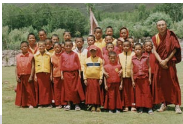
欽哲基金會經由拉達克的超戒寺僧伽教育協會所護持的拉達克學校的學僧們。

贊助加拿大哈利法克斯市「香巴拉學校」顧問到訪，以對澳洲新設佛教兒童學校事宜提供諮詢。